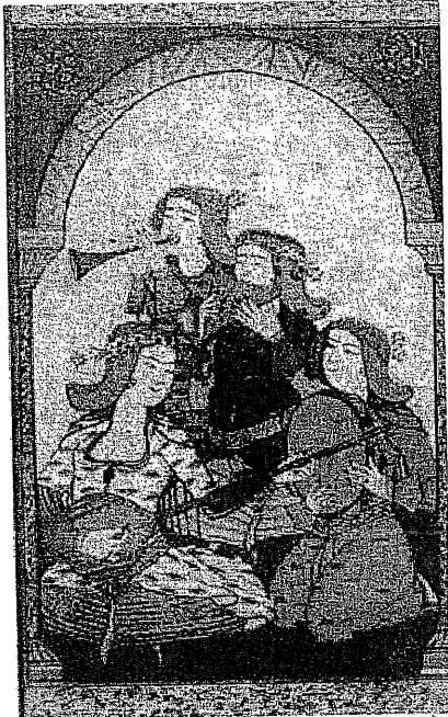
Fârâbî'nin, eserlerinde, enstrümanlarla ilgili detaylı bilgiler vermiş olması ve ses fiziği alanında Yunanlıları aşması, ona müzik tarihinde müstesna bir yer kazandırmıştır.

Felsefede Aristo'dan sonra "Muallim-i Sâni" (İkinci Üstad), müzik ilminde "Muallim-i Evvel" (Birinci Üstad) olarak kabul edilen Ebu Nasr Muhammed b. Tarhan b. Uzlûğ el-Fârâbî (ö. 950), müzik nazariyatını Aristo, Themistius ve Öklid gibi ünlü Grek alimlerin Arapçaya tercüme