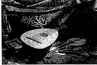
Fârâbî'nin Kitâbü'l-Mûsîka'l-Kebîr'i, Batı ve İslam dünyasında müzik teorisi üzerine yazılmış Arapça kitaplar arasında en kapsamlı ve sistematik olanıdır.

Fârâbî'nin mûsikî ilminde Grek müelliflerini kaynak aldığı bilinen bir gerçek olmakla birlikte onun asil gerçekleştirdiği şey, mevcut mûsikîyi Greklerin mûsikî nazariyatı eserlerinden yararlanarak belirli bir sistem içine sokmak ve kurallarını koymak olmuştur. Zira Fârâbî Kitâbü'l-