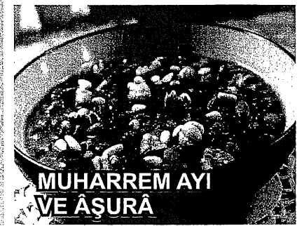
MUHARREM AYI VE AŞURÂ